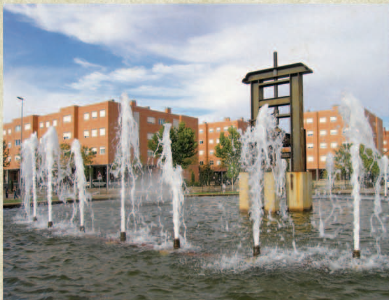
Vista general de una urbanización de la zona "Espartales" en Alcalá de Henares.

Es un hecho que la posibilidad de acceder a una necesidad tan vital como es la adquisición de una vivienda, para personas que tienen ingresos medios, presenta grandes dificultades. El precio del suelo y los costos que repercuten en el precio de la vivienda, alcanza el equivalente a muchos años de los ingresos que obtiene una persona por su trabajo. El mercado ha mantenido un alto crecimiento, pero a costa de aumentar el tiempo de amortización de las hipotecas, hasta llevarlo a 30 ó más años.