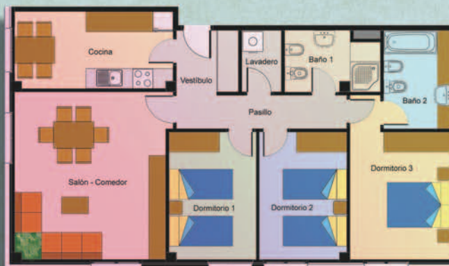
Ejemplo de vivienda de 3 dormitorios.

La orientación económica para una VPPL (viviendas públicas de precio limitado) supone que, dándose las condiciones en el socio cooperativista para acceder a ella, puede adquirir la vivienda a un precio final en torno a 165.000 € con plaza de garaje incluida, cifra que con un crédito hipotecario, en torno a 120.000 €, permite al cooperativista adjudicarse una vivienda con un desembolso hasta la entrega de llaves por la diferencia.